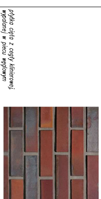
płytki cięta z cegły klinierowej; wypalanej w piecu węglowym